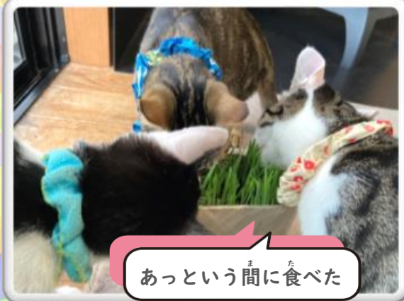
あっという間に食べた